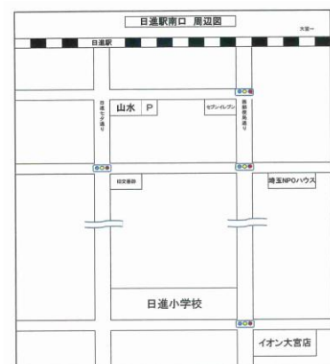
埼玉NPOハウス案内図

【アクセス】日進駅南口より西郵便局 通り(七夕通りより1本東側のイオン 大宮店へ行く通り)徒歩5分。